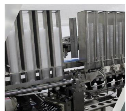
FORMATS PRE INSTALLES