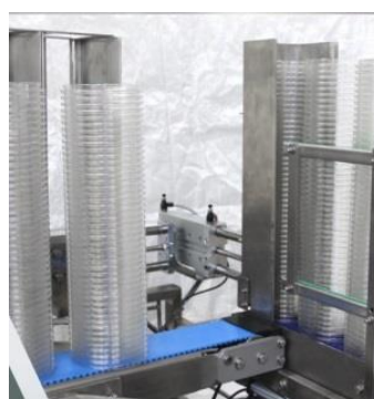
CHARGEUR AVEC RENVOI D'ANGLE A90°