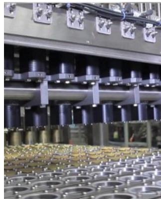
DEPILAGE DOUBLE TETE